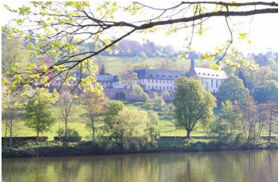
Die Abtei Neuburg liegt malerisch oberhalb des Neckars im Stadtteil Ziegelhausen.

1926 erwarb der Benediktinerorden das Areal wieder und begründete das Kloster neu. Für das Jubiläumsjahr 2026, so berichtet P. Benedikt, sei eine Reihe von schönen Konzerten geplant – und