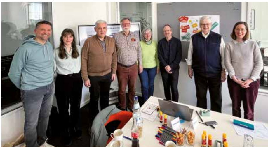
Die Teilnehmenden des Workshops tauschten sich über ein Pfarrei-Logo aus.

Der Workshop bot auch Raum für tiefgehende Gespräche. Dabei wurde deutlich, dass Menschen in allen Altersgruppen auf der Suche nach Gemeinschaft sind und in ihrer Kirchengemeinde eine Heimat sehen. Deshalb ist es wichtig, dass sich die Kirche einladend und mo-