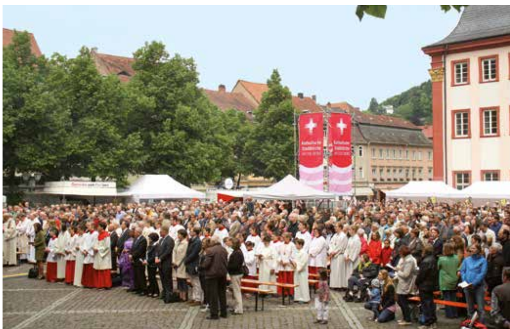
Am 17. Mai 2015 hatte die Stadtkirche ihre Gründung mit einem großen Fest auf dem Universitätsplatz gefeiert. Rund 2000 Gläubige hatten seinerzeit den Festgottesdienst mit Erzbischof Stephan Burger mitgefeiert.