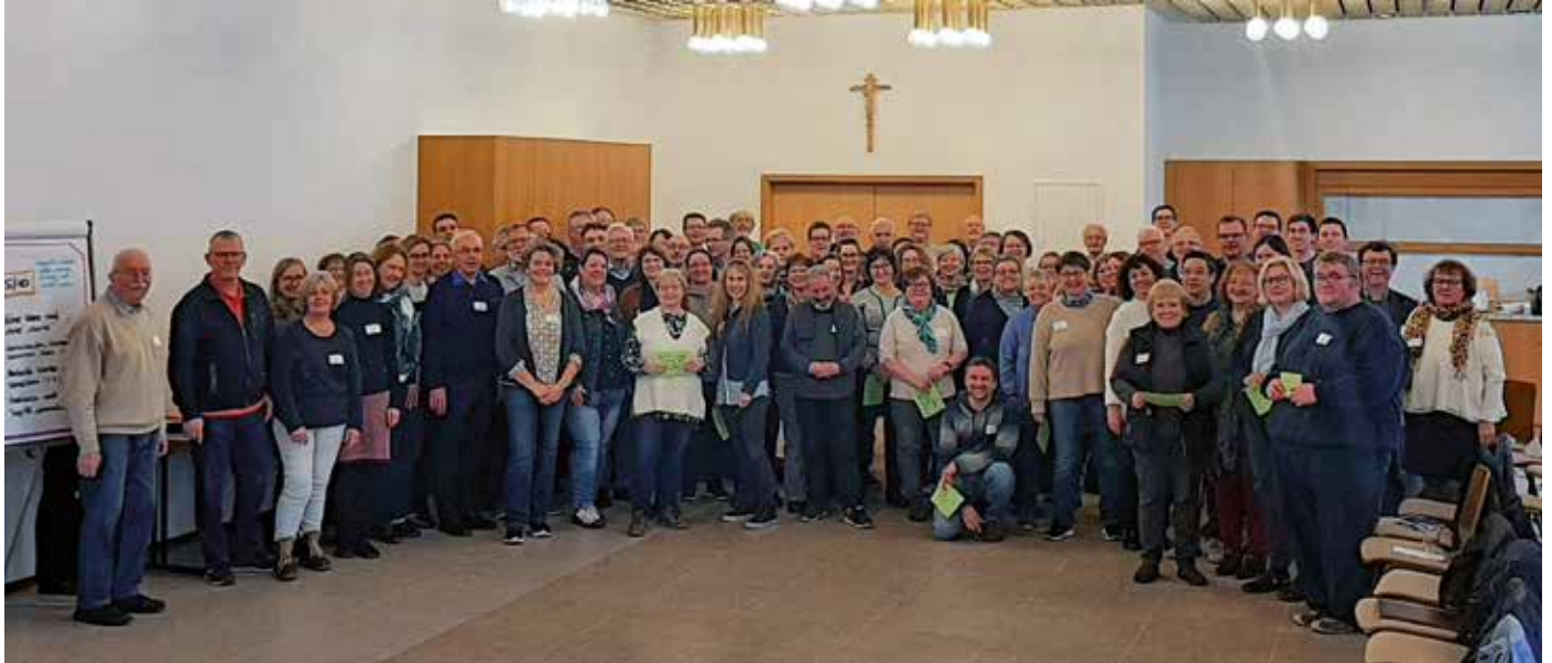
Mehr als 80 Personen nahmen am Treffen der Arbeitsgruppen Anfang Februar in Schriesheim teil.