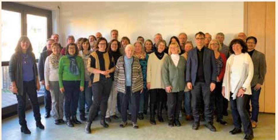
Der Austausch über Fragen der Kirchenmusik stand im Mittelpunkt der Jahreskonferenz Kirchenmusik im Dekanat Heidelberg-Weinheim.

Die Kirchengemeinde Heidelberg ist schon weiter. Die Gründung der Stadtkirche Heidelberg erfolgte im Jahr 2015.