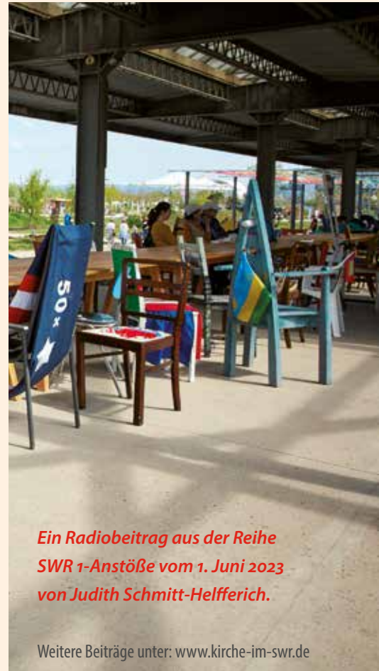
Ein Radiobeitrag aus der Reihe SWR 1-Anstöße vom 1. Juni 2023 von Judith Schmitt-Helfferich.

Vom Frieden unter den Völkern und Religionen sind wir leider weit entfernt. Aber so viele sehnen sich danach. Daran erinnert mich der biblische Text und der „Tisch der Nationen“.