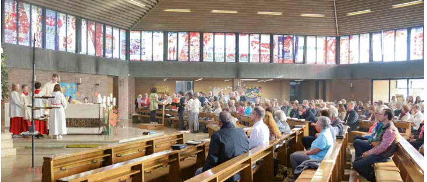
Unter dem bunten Fensterband mit biblischen Motiven des Künstlers Franz Dewald in der Heddesheimer Remigiuskirche versammelten sich Christen aus allen fünf Kirchengemeinden zur Feier der Eucharistie.