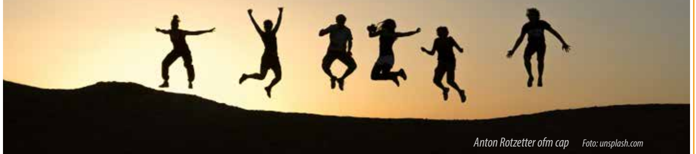
Anton Rotzetter ofm cap

Es kommt und geht und wirkt und lebt weil Du in allem das Leben bist Leben, das den Tod überdauert