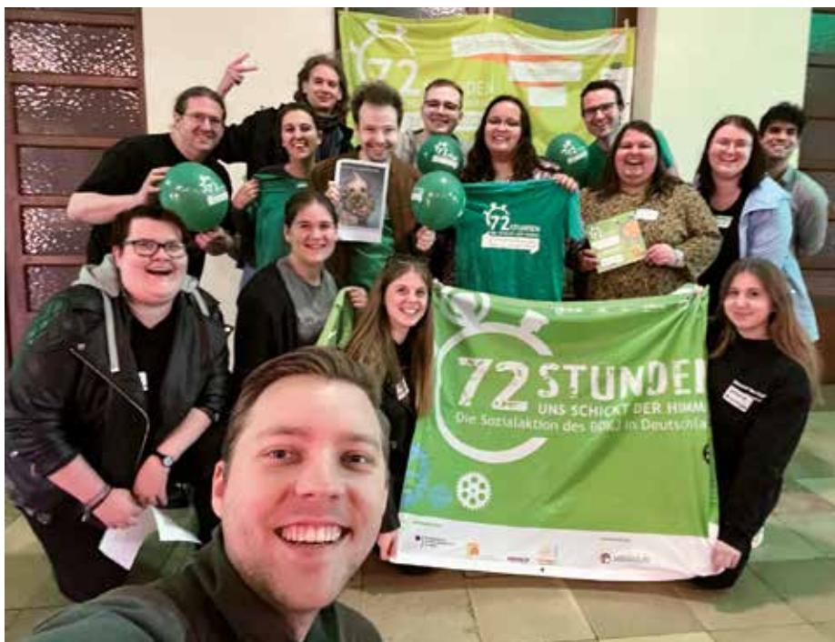
Ein Selfie mit vielen Engagierten, die Lust haben, im April des kommenden Jahres viele Projekte zu begleiten.