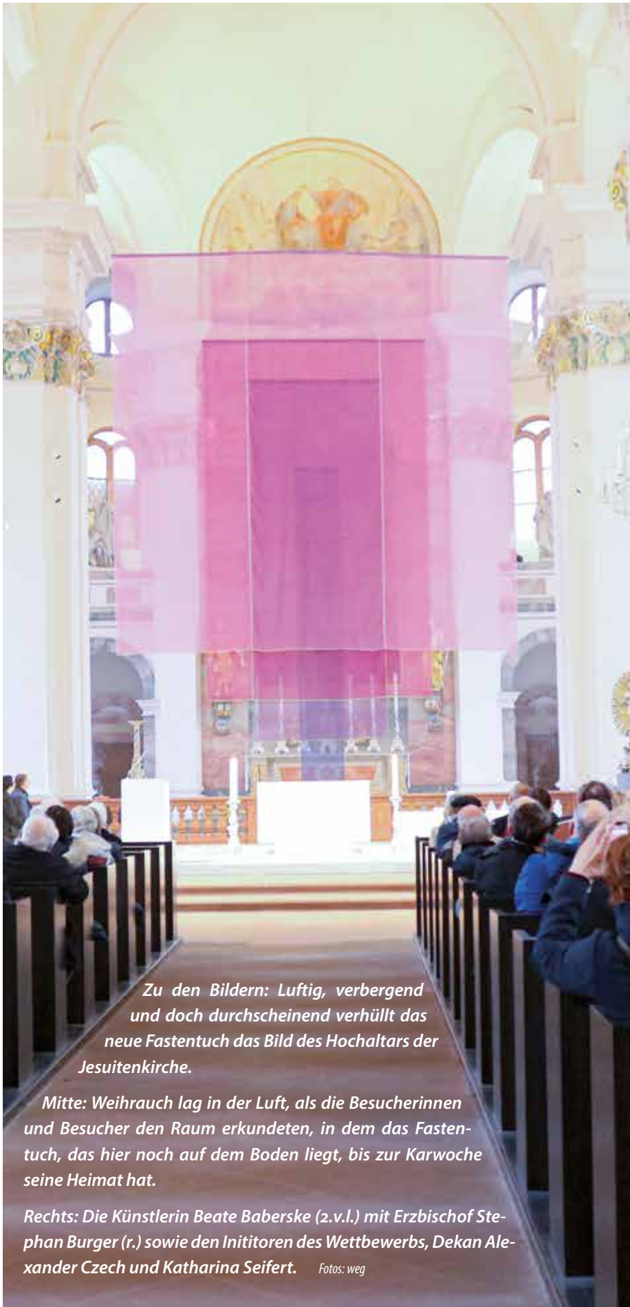
Zu den Bildern: Luftig, verbergend und doch durchscheinend verhüllt das neue Fastentuch das Bild des Hochaltars der Jesuitenkirche.