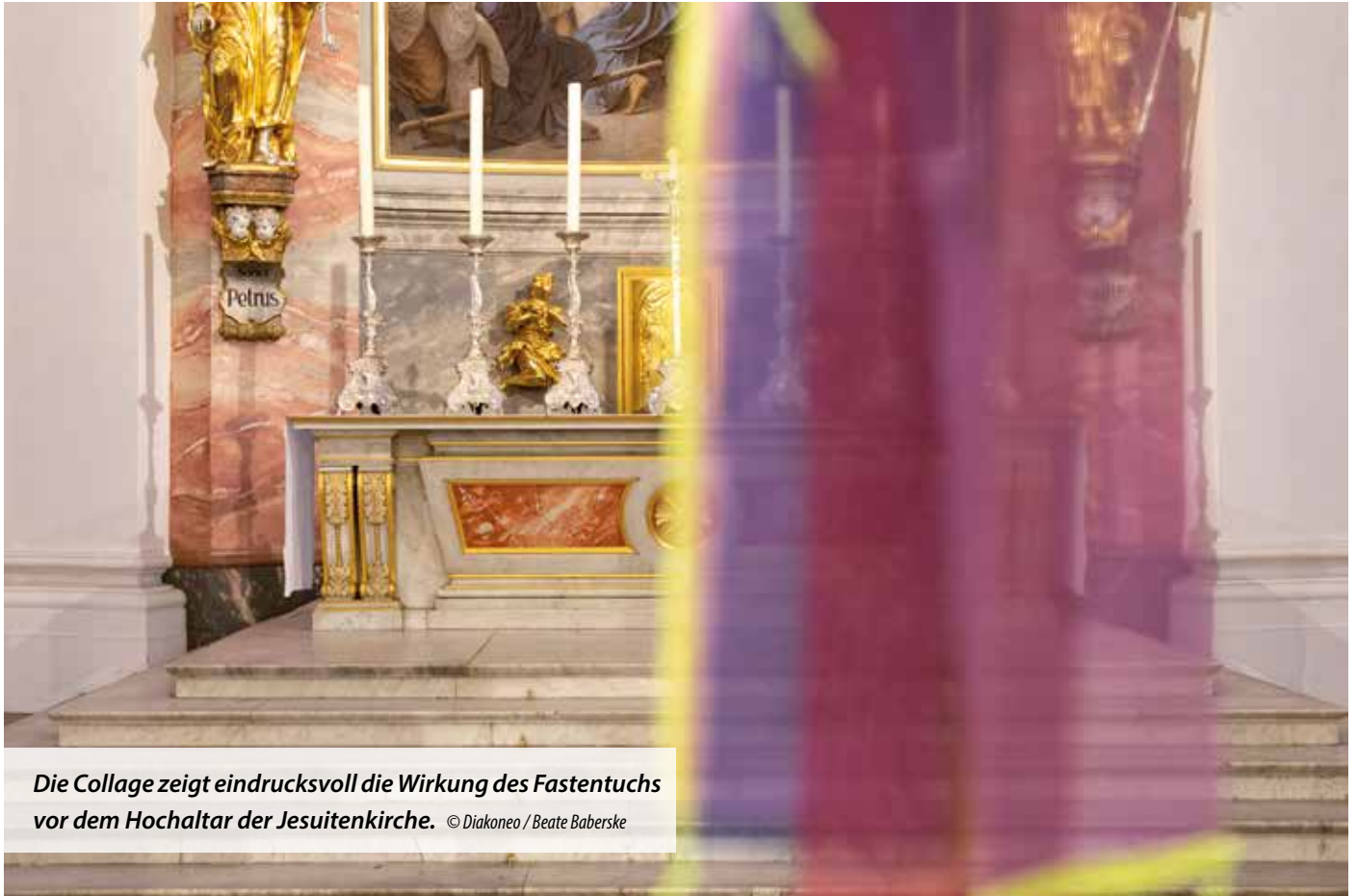
Die Collage zeigt eindrucksvoll die Wirkung des Fastentuchs vor dem Hochaltar der Jesuitenkirche.

Bistumsweiter Aschermittwoch der Künstlerinnen und Künstler mit Erzbischof Stephan Burger findet am 22. Februar in Heidelberg statt