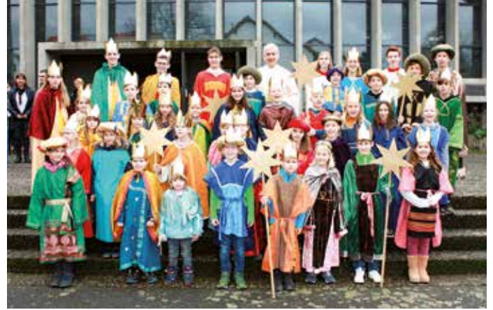
Sternsingerinnen und Sternsinger waren in allen Kirchengemeinden des Dekanats unterwegs. Die Bilder stammen aus Heidelberg (l.) und Großsachsen (r.), aus Heiligkreuzsteinach, Schriesheim, Laudenbach und Heddesheim (linke Spalte v. o.).