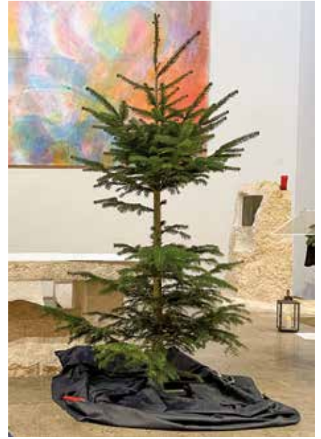
Die Lücken im Baum erinnern an verstorbene Kinder.

Trauern und Abschiednehmen sind sehr persönliche Momente. Dabei hilft vielen der Gedenkgottesdienst im Dezember.