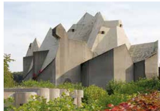
Der Mariendom in Neviges

Kath. Jugendbüro, Eisenlohrstr. 6, 69115 Heidelberg, Tel.: 06221-905640 www.kja-hw.de