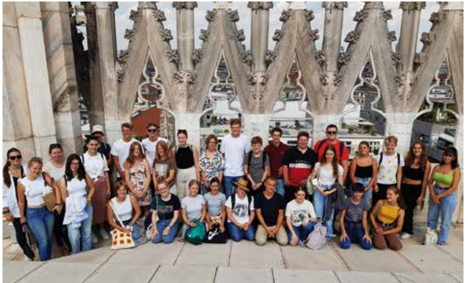
Gruppenbild auf dem Dach des Mailänder Doms

Direkt am ersten Tag ging es hoch hinaus. Mit einer Seilbahn (Eimergondel) fuhren wir auf den tausend Meter hohen Berg „sasso del ferro“ und genossen den traumhaften Blick auf den Lago Maggiore. Doch wie es sich für eine Sommerwoche dort gehört, wurde natürlich nicht nur der Anblick des Lago Maggiore genossen, sondern auch die Zeit im See. Durch die perfekte Lage des Jugendzentrums in Brebbia konnte man jederzeit baden, Stand-up-Paddeln oder Ruderboot fahren. Wer keine Lust auf das Baden im See hatte, konnte sich auf dem Gelände gut beschäftigen: mit Volleyball, Tischkicker und Tischtennis. Und auch die klassischen Kartenspiele wie Phase 10, Werwolf, Skip Bo und Co. kamen nicht zu kurz.