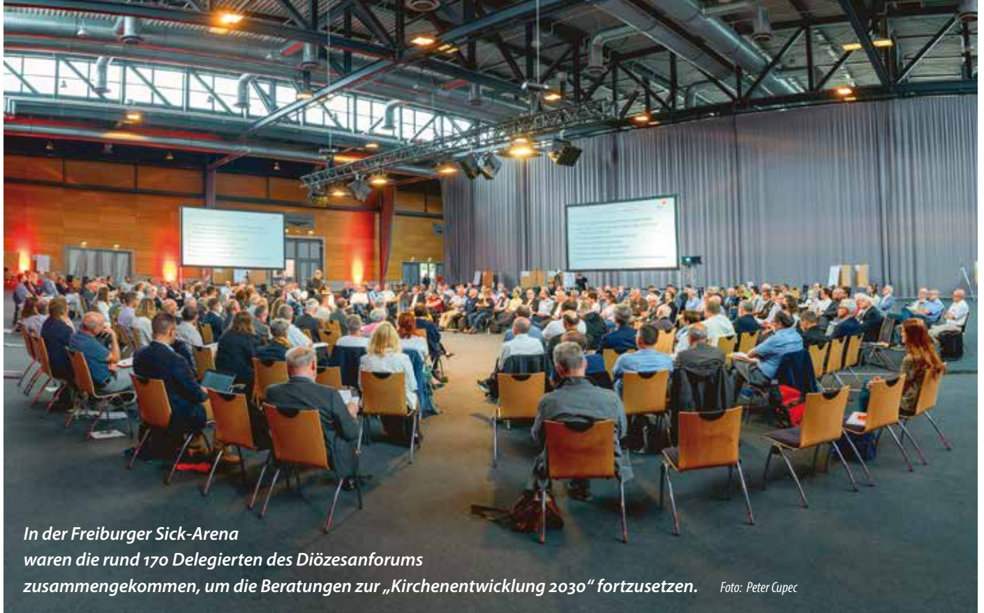
In der Freiburger Sick-Arena waren die rund 170 Delegierten des Diözesanforums zusammengesessen, um die Beratungen zur „Kirchenentwicklung 2030“ fortzusetzen.