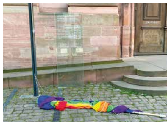
Am 12. Juni lag die Regenbogenfahne schwer beschädigt auf dem Boden.

Für Christian Ende und die Verantwortlichen der Altstadtgemeinde ist der Vorfall vom vergangenen Wochenende enttäuschend und nicht hinzunehmen. „Wir sind für alle da und wollen niemanden ausgrenzen“, betont Christian Ende. „Wir wünschen uns, dass Kritik nicht mit