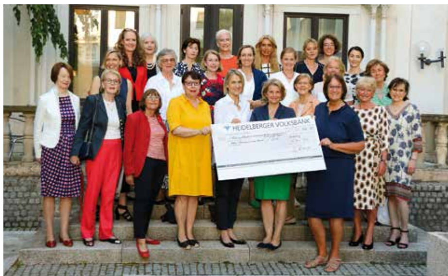
Mit der Übergabe des Schecks über 37.166,50 Euro wurde die Spendensumme von 250.000 Euro für den Fonds „Altersarmut und Frauen“ erreicht.

natürlich bestehen bleiben. Wer dies möchte, kann Gottesdienste künftig wieder durchgängig ohne Maske mitfeiern. Auch die Einhaltung von Abständen wird wieder ganz dem Ermessen der Teilnehmenden und deren wechselseitiger Rücksichtnahme überlassen. Welche Regeln aktuell in den Kirchengemeinden des Dekanats gelten, erfahren sie auf deren Internetseiten. red