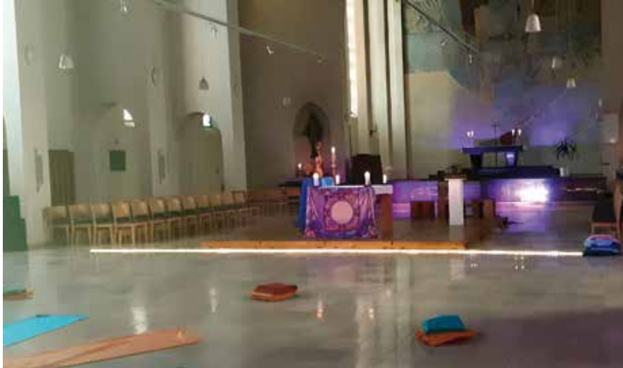
In farbiges Licht getaucht, empfing die frühere Pfarrkirche St. Albert die Besucherinnen und Besucher beim Erlebnisabend.