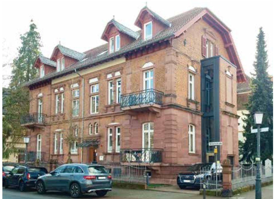
In das Haus Wilhelmstraße 3, vis à vis der St. Bonifatius-Kirche in der Heidelberger Weststadt, ist das Hospiz vor sechs Jahren eingezogen.

seinen geliebten Odenwald gewünscht. Andere genießen noch einmal den Duft von frisch gebackenen Plätzchen in der Weihnachtszeit. Manche wünschen sich einfach jemanden, der bei ihnen sitzt und das Schweigen teilt. Für solche Aufgaben sind unter anderem ehrenamtliche Mitarbeiter dabei. „Haupt- wie ehrenamtliche Mitarbeiter werden durch Supervision begleitet“, erklärt Leiter Schöberl. „Wir haben auch Rituale des Abschieds. Wenn Begleiter den Raum bekommen, sich von einem Verstorbe-