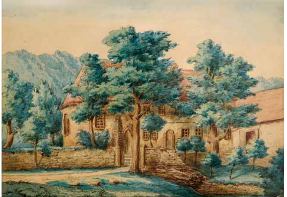
Das Aquarell des Philibert von Graimberg ist das einzige vorhandene Dokument, das die Kapelle mit dem Gutleuthof zeigt. Die Aufnahme links zeigt die Kapelle in ihrem heutigen Zustand.