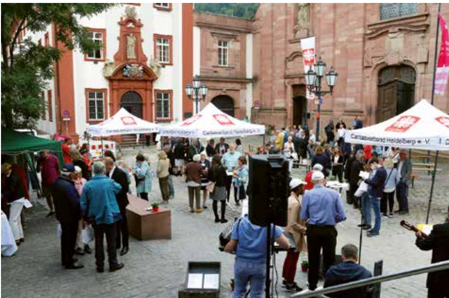
Musik, ein Gläschen zum Anstoßen und zahllose Begegnungen und Gespräche gab es nach dem Gottesdienst auf dem Richard-Hauser-Platz.

„Wir brauchen dieses Miteinander heute und müssen es immer wieder neu durchbuchstabieren“, ergänzte er. Und