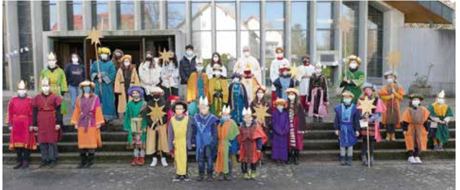
Sternsingerinnen und -singer vor der Christkönigkirche in Großsachsen.

Dabei gab es in den einzelnen Pfarreien unterschiedliche Lösungen. Während in St. Jakobus Lützel-, Hohen- und Großsachsen und St. Marien in der Weinheimer Weststadt die Sternsinger mehrere Tage live unterwegs waren, wurde der Segen der heiligen drei Könige in Herz Jesu Oberflockenbach, St. Johannes Leutershausen und St. Laurentius und Herz Jesu Weinheim in den jeweiligen Gottesdiensten für alle gespendet. Hier lag der Segen in den Kirchen aus oder wurde auf Bestellung zugestellt. Es konnte online gespendet werden und