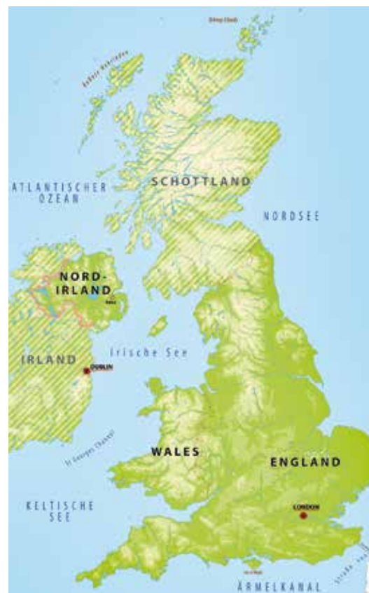
Aus England, Wales und Nordirland kommt die Liturgie des WGT 2022.

2022 hat der Weltgebetstag drei Gastgeberländer – aber nicht ganz Großbritannien. Schottland und die Republik Irland haben aus historischen Gründen eigene Komitees, die in sehr engem Kontakt mit dem EWNK-Komitee stehen. Trotz der vielen Gemeinsamkeiten gibt es zwischen den Themenländern auch deutliche Unterschiede. England ist mit 130.000 km 2 der größte und am dichtesten besiedelte Teil des Königreichs – über 55 Millionen Menschen leben in England. In Wales leben rund drei Millionen Menschen, in Nordirland zwei Millionen. Mehr als die Hälfte der Bevölkerung ist konfessionslos, 32 Prozent gehören zu einer christlichen Kirche an.